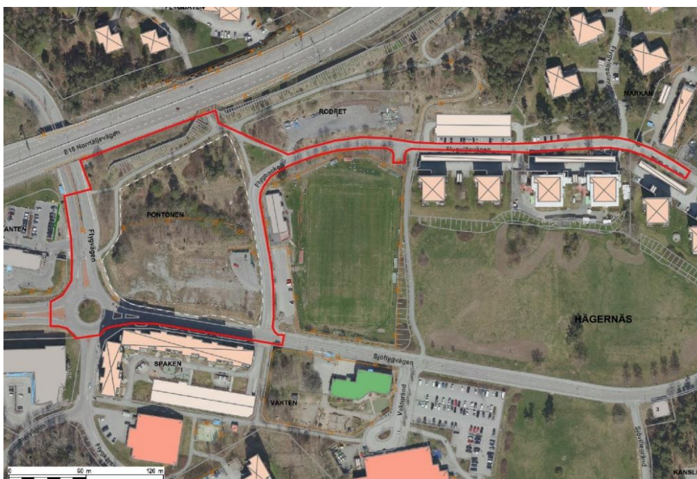
Figur 1. Preliminär planavgränsning. Vit streckad linje visar fastighetsgränsen för Pontonen 1.

Projektet kommer också beakta arbetet med en ny cykelplan, som kan påverka projektet.